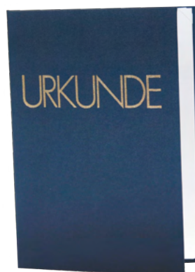
21x30 cm Art-Nr. LEI1 24x32 cm Art-Nr. LEI2 30x42 cm Art-Nr. LEI3