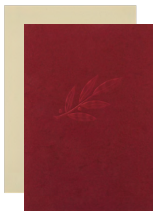
21x30 cm Art-Nr. UM1-C od. UM1-W 24x32 cm Art-Nr. UM2-C od. UM2-W 30x42 cm Art-Nr. UM3-C od. UM3-W

Die preislich günstigen Urkundenmappen aus ledergenarbttem Karton weisen als erhaben geprägtes Blattmotiv einen stilisierten Lorbeerzweig auf. Eine kleine Plastikflasche in der Innenseite verhindert ein Herausrutschen der Urkunde. Für herausragende Ehrungen stehen verschiedene Mappen aus wattiertem Skivertex, in Leinenstruktur oder aus echtem Leder zur Verfügung. Die Dokumente lassen sich zusätzlich durch Zellophanhüllen (ohne Abb.) schützen.