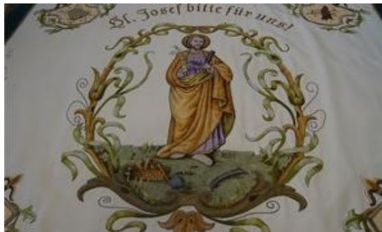
Der Heilige Josef ziert die Fahne des Burschenvereins.

Auf der einen Seite der Fahne fand der Heilige Josef als religiöses Vorbild für die Burschen seinen Platz, auf der anderen Seite zierte ein heimatliches Motiv das Banner. Laut Aufzeichnungen schaffte man noch Fahnenbänder der Jungfrauen für 50,50 Mark sowie sechs Erinnerungsbänder im Wert von