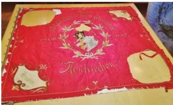
Die Burschenfahne vor der Restaurierung mit den herausgetrennten Tugenden

Mittagsmahl zog der Burschenverein mit der Fahne zum Rosenkranzgebet in die Kirche. Erst dann zog der Festzug durch die festlich geschmückte Ortschaft. Jetzt hatte man Gelegenheit, Gästen und Zuschauern die Fahne zu präsentieren. Die Fahnenweihe nahm einen gelungen Verlauf und trug zur Stärkung der Kameradschaft innerhalb des Vereins bei. Die Burschenfahne des katholischen Burschenvereins Neukirchen wurde einst als die schönste beim Landestreffen der Burschenvereine Bayerns in München prämiert.