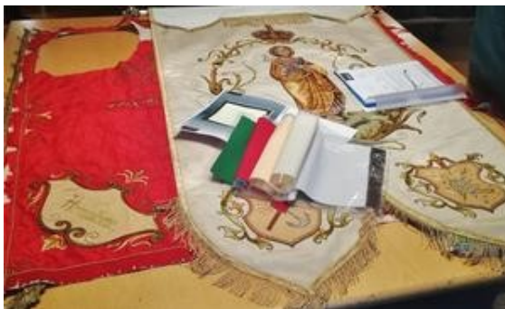
Die Josefsfahne liegt auf der Burschenfahne

Die unvollständige Fahne lag bis Ende 2018 in der Schachtel. Doch die Burschen und Mädchen wollten, dass die Fahne wieder in den ursprünglichen Zustand versetzt wird. Nachdem die Firma Kössinger in Schierling eine Kostenaufstellung